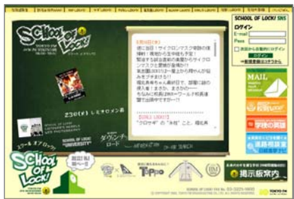
SOL! ユニバーシティ へのバナー