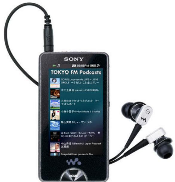
※画面はハメコミ合成です

今回新しく立ち上がった「TOKYO FM Podcasts for “WALKMAN”」は、“ウォークマン”からのアクセスに最適化された TOKYO FM のページに“ウォークマン”NW-X1000 シリーズからワンタッチでアクセスし、無線 LAN 経由で直接 Podcast がダウンロード・視聴できるものです。