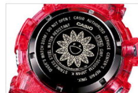
バックベゼルにこまごま今回のG-SHOCKの為に描き起こされたダイヤモンドの華やかな花が。