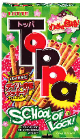
第6弾（2011年版） 表パッケージ