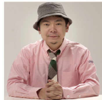
【パーソナリティ】 鈴木おさむ