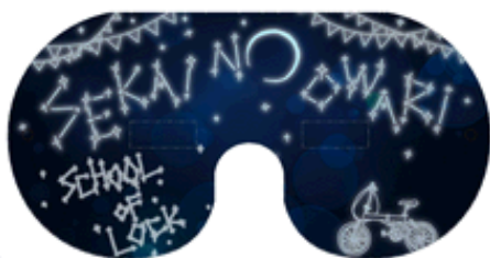
SEKAI NO OWARI × 『SCHOOL OF LOCK!』

★TOKYO FM オンラインショップ「Shops. Love」 ( http://shop.tfm.co.jp/shop/ ) で発売中