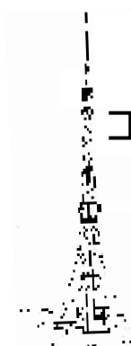
⇒現在の当社アンテナ

当社のFM送信アンテナは、1970年の開局以来、東京タワーの地上高180m～220mに設置され、当社、NHK FM、J-WAVEの3社共建で運営されておりました。当社、現状のFM送信アンテナの仕様は以下の通りです。