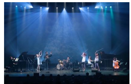
村上春樹を『聴く』 2016年2月29日 東京凱旋公演 アンコール曲