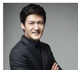
チヨ・ジェヒョク