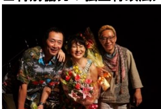
国府弘子スペシャルトリオ