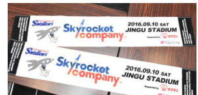
『スワローズ』×『Skyrocket Company』 オリジナルコラボマフラータオル