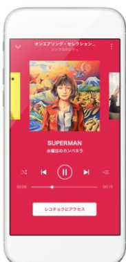
◀オンエア情報からレコチョクへ直接アクセス

全国のFM局スタッフが厳選した各番組のオンエア楽曲やチャートから、試聴～購入までをシームレスにつなぎます。※ドコモの「スゴ得コンテンツ」版、ソフトバンクの「App Pass」版ではご利用頂けません。