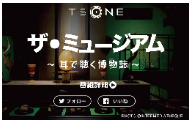
デジタル地上波最高音質の音声と共に、スマートフォンで画像や関連情報も

丹青社と東京大学の産学連携により行われてきた15年にわたる東京大学の寄付講座「ミュージアム・テクノロジー」の研究成果の一つとして、放送×通信の特性を活かした新しいステーションである「TS ONE」とのコラボレーションが実現し、“音声による博物館体験”という新しい体験価値を生み出します。