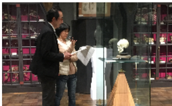
博物館内で収録、目の前で展示物を見ているような音声体験を提供