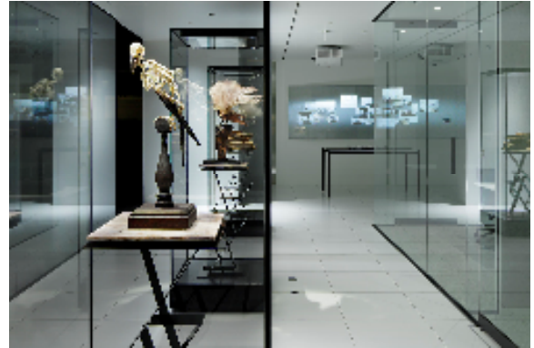
丹青社本社レセプションエリアのモバイルミュージアム

展示コンテンツをコンパクトにパッケージ化し、 学校、企業などのパブリックスペースに展示