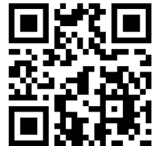
▲ショッピングサイトQRコード

ショッピングサイト: https://shop.tfm.co.jp/categories/5484324