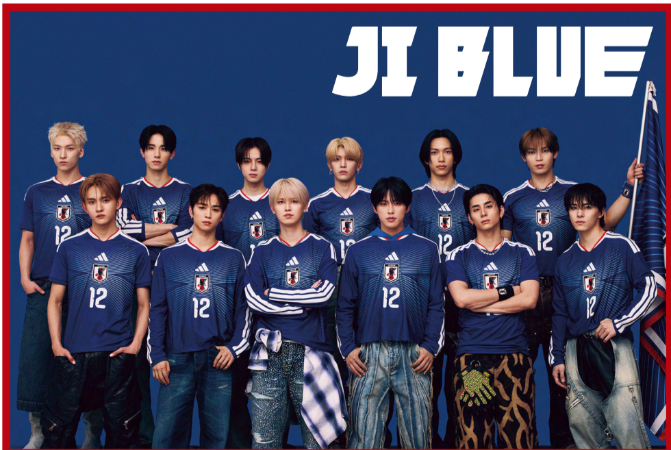
JI BLUE: JO1とINIのサッカーを愛するメンバーが集結したスペシャルユニット。サッカー日本代表「最高の景色を2026」オフィシャルアンバサダーを務める。

—JI BLUEとして、サッカー日本代表「最高の景色を2026」オフィシャルアンバサダーに抜擢された時や、公式テーマソング『景色』を受け取った時の想いは？