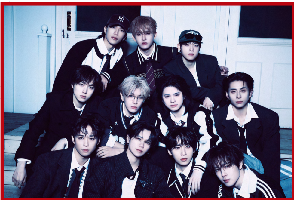
INI: サバイバルオーディション番組「PRODUCE 101 JAPAN SEASON2」を通じて結成された11人組グローバルボーイズグループ。 2021年のデビュー以来、ハイクオリティなパフォーマンスで国内外のチャートを席巻し続ける。